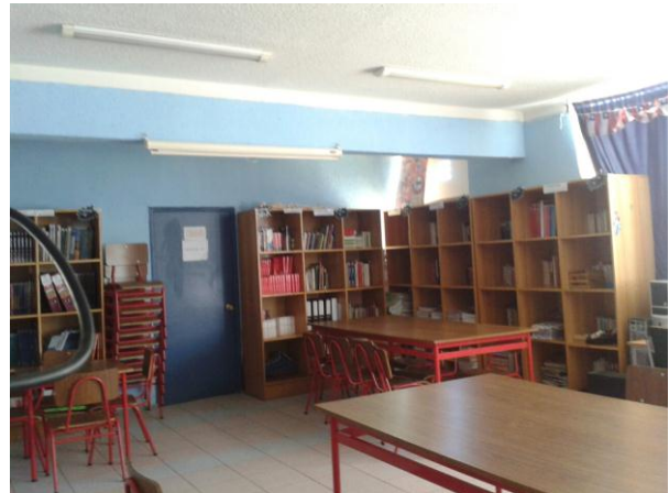
Proyecto de mejoramiento Biblioteca Escuela Nuestra Señora del Rosario