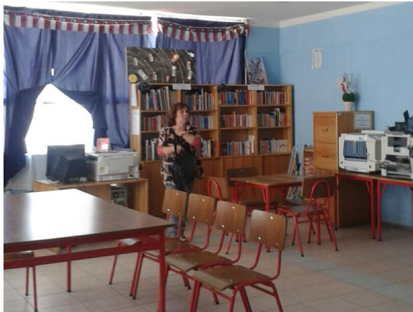
Biblioteca Actual Escuela Nuestra Señora del Rosario

Diseñador de Ambientes DAEM Municipalidad Andacollo Proyectar mejoramiento a las salas de prebásica de la escuela básica "Luis Cruz Martínez" (prekinder, kínder) y patio de estas, además de la biblioteca y patio del sector de prebásica de la escuela "Nuestra Señora del Rosario"; generando ambientes más pedagógico, amigables e innovador para los usuarios.